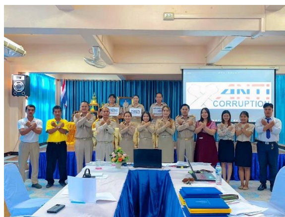
ประกาศแนวทางการใช้ทรัพยากรทางราชการในที่ประชุมครูประจำเดือน