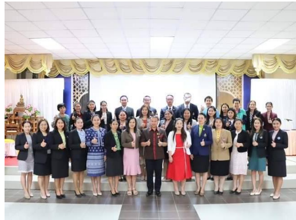
บุคลากรทางการศึกษาเข้ารับการพัฒนา อบรมและนำความรู้ความเข้าใจในเรื่องระเบียบการเงินการคลัง