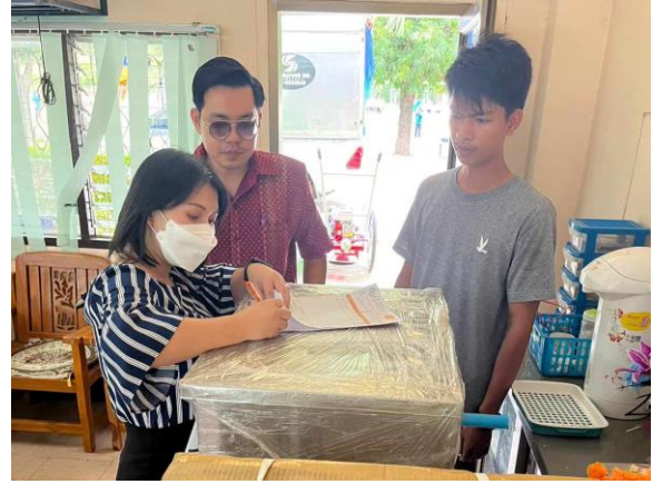
การตรวจสอบการจัดซื้อ จัดจ้าง พัสดุ

๕. ส่งเสริม สนับสนุนให้บุคลากรที่ปฏิบัติงานด้านการ จัดซื้อจัดจ้าง เข้ารับการอบรมระเบียบและแนวทาง ปฏิบัติด้านการพัสดุ เพื่อสร้างความรู้ความเข้าใจที่ถูกต้อง และเป็นการทบทวนกฎ ระเบียบให้มีความเป็นปัจจุบัน