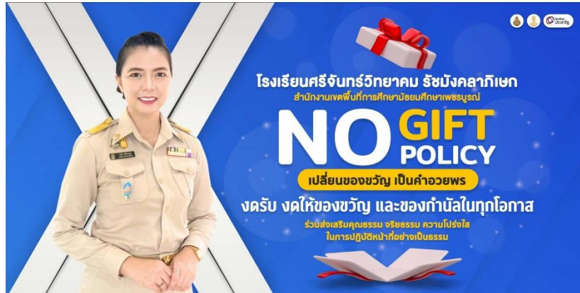
การเผยแพร่การป้องกันการรับสินบนบนเว็บไซต์