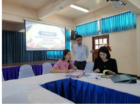
รับการนิเทศจากหน่วยตรวจสอบภายใน สพม.เพชรบูรณ์

๔. กำหนดให้มีการสับเปลี่ยน หมุนเวียนหน้าที่ระหว่าง บุคลากรเป็นครั้งคราว เพื่อมิให้บุคคลใด บุคคลหนึ่งทำงานในหน้าที่เดิมอย่างต่อเนื่องเป็นระยะเวลาานาน จนอาจเกิดความเสี่ยงต่อการทุจริตในหน้าที่ ประกาศมาตรการส่งเสริมความโปร่งใสในการจัดซื้อจัดจ้าง ของโรงเรียนศรีจันทร์วิทยาคม รัชมังคลาภิเษก