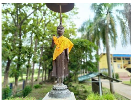
พระพุทธรูปประจำโรงเรียน