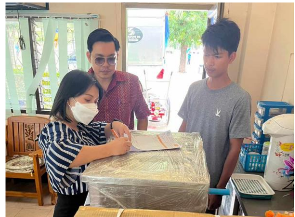
การตรวจสอบการจัดซื้อ จัดจ้าง พัสดุ