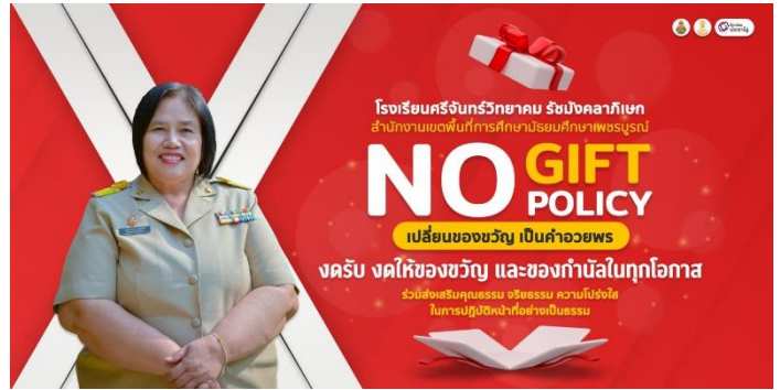
การเผยแพร่การป้องกันการรับสินบนบนเว็บไซต์