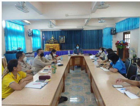
การประชุมประจำเดือน

2.2 ประกาศแนวทางการใช้ทรัพยากรทางราชการในที่ประชุมครูประจำเดือนและการนิเทศกลุ่มสาระการเรียนรู้ การใช้อุปกรณ์ในการจัดการเรียนการสอนโดยคำนึงถึงความประหยัดและคุ้มค่าเพื่อประโยชน์ในทางราชการ