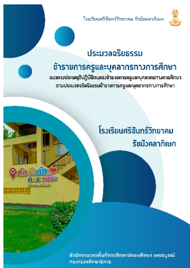
ประมวลจริยธรรมข้าราชการครูและบุคลากรทางการศึกษา

1.4 ประกาศมาตรการป้องกันการรับสินบนจากการปฏิบัติหน้าที่ โดยแจ้งให้ผู้บริหารข้าราชการครูและบุคลากรทางการศึกษาทราบในที่ประชุมครูและบน เว็บไซต์ของโรงเรียน