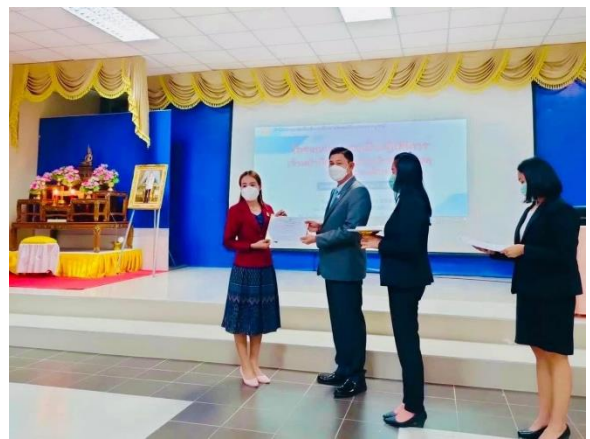
บุคลากรทางการศึกษาเข้ารับการพัฒนา อบรมและนำความรู้ความเข้าใจ ในเรื่องระเบียบการเงินการคลัง