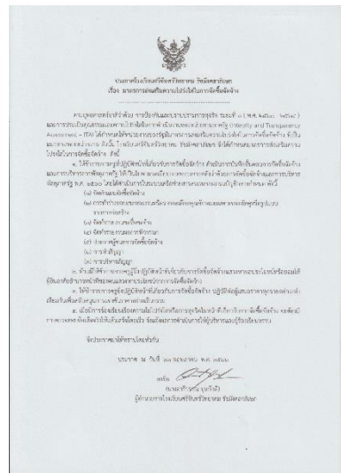
มาตรการส่งเสริมความโปร่งใสในการจัดซื้อจัดจ้าง

3.3 ประกาศมาตรการส่งเสริมความโปร่งใสในการจัดซื้อจัดจ้าง ของโรงเรียนศรีจันทร์ วิทยาคม รักษามังคลาภิเษก