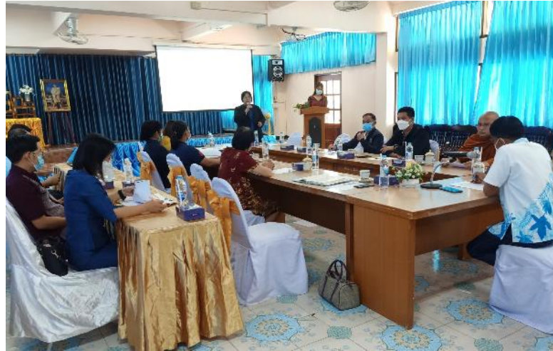
ภาพการประชุมคณะกรรมการการศึกษาขั้นพื้นฐาน วันที่ 17 พฤศจิกายน 2565

ณ ห้องโสตทัศนศึกษา โรงเรียนศรีจันทร์วิทยาคม รัชมังคลาภิเษก