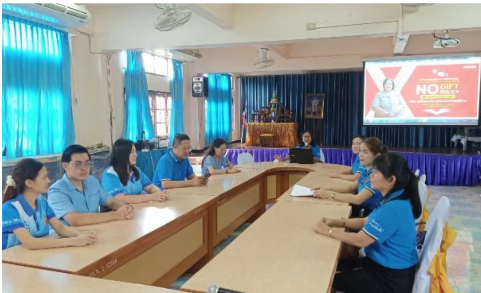
ภาพการประชุมชี้แจง สร้างความเข้าใจแก่บุคลากรในสถานศึกษา