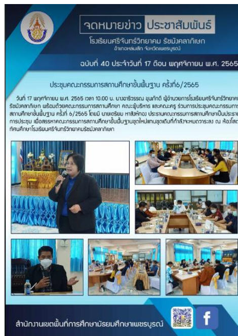
ภาพจดหมายข่าวการประชุมคณะกรรมการสถานศึกษาขั้นพื้นฐานที่เผยแพร่ในเว็บไซต์และfacebook

ณ ห้องโสตทัศนศึกษา โรงเรียนศรีจันทร์วิทยาคม รัชมังคลาภิเษก